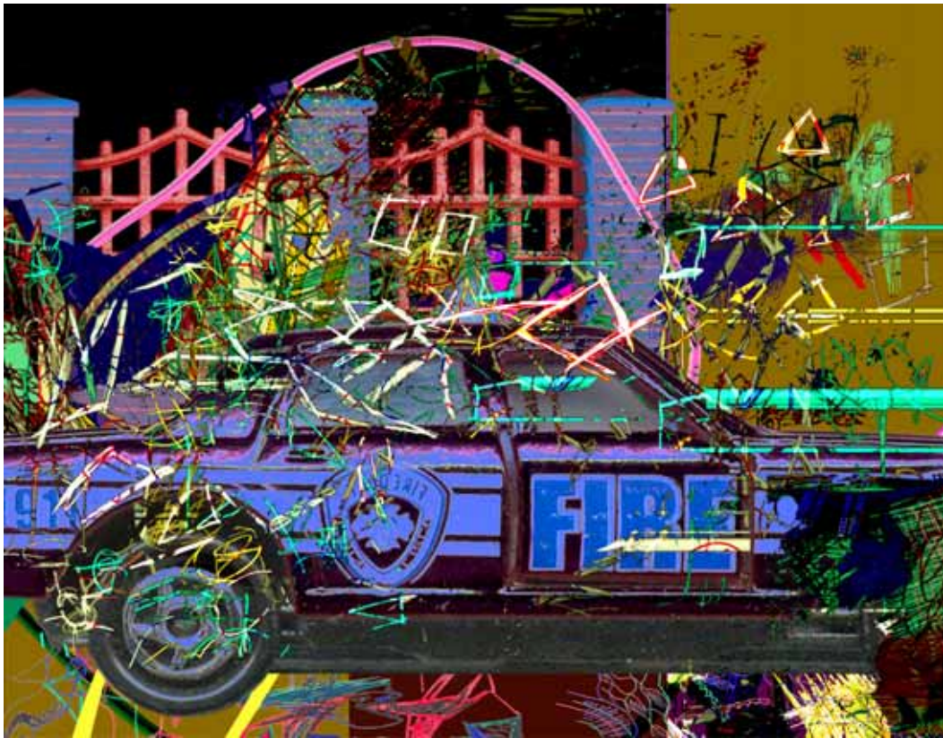
2007 - Sans titre - Série Au feu les pompiers - 180 x 140 cm - impression numérique et acrylique sur toile.